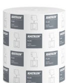
57795 Katrin Plus System Handtuchrolle M 2-lagig