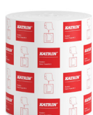
58198 Katrin System Handtuchrolle M 2-lagig