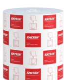
460263 Katrin System Handtuchrolle M 2-lagig, Blau