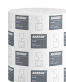
460058 Katrin Plus System Handtuchrolle M 445 Blatt 2-lagig