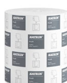
38015 Katrin Plus System Handtuchrolle M 3-lagig